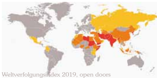
Weltverfolgungsindex 2019, open doors

Die Bedrängnis der Christen in den 50 Ländern des Weltverfolgungsindex hat gegenüber dem Vorjahr durch noch mehr gewaltsame Übergriffe und massive Unterdrückung deutlich