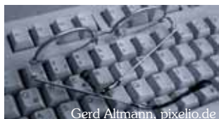
Gerd Altmann, pixelio.de

Redaktionsschluss für den nächsten Gemeinschaftsbrief ist am Freitag, 18.01.2019